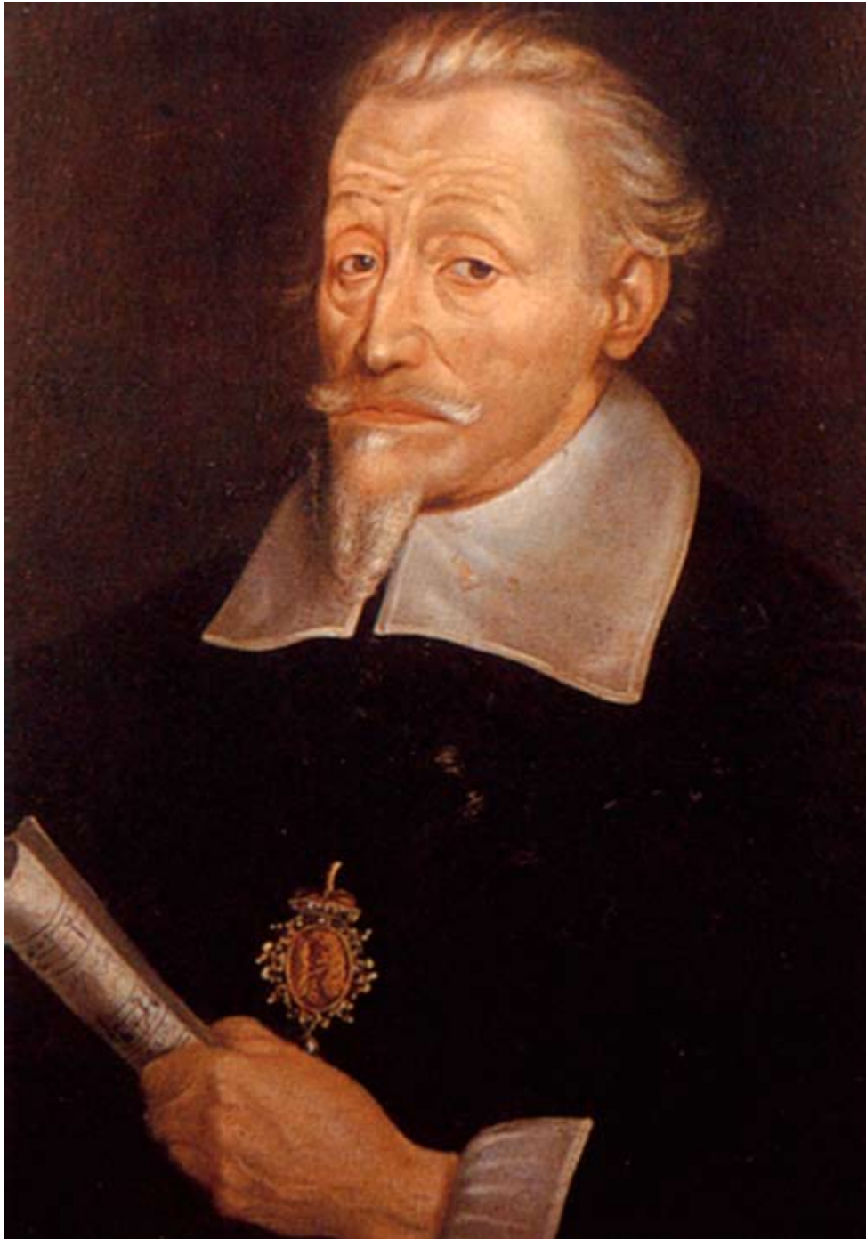
Heinrich Schütz door Christoph Spetner ca. 1650