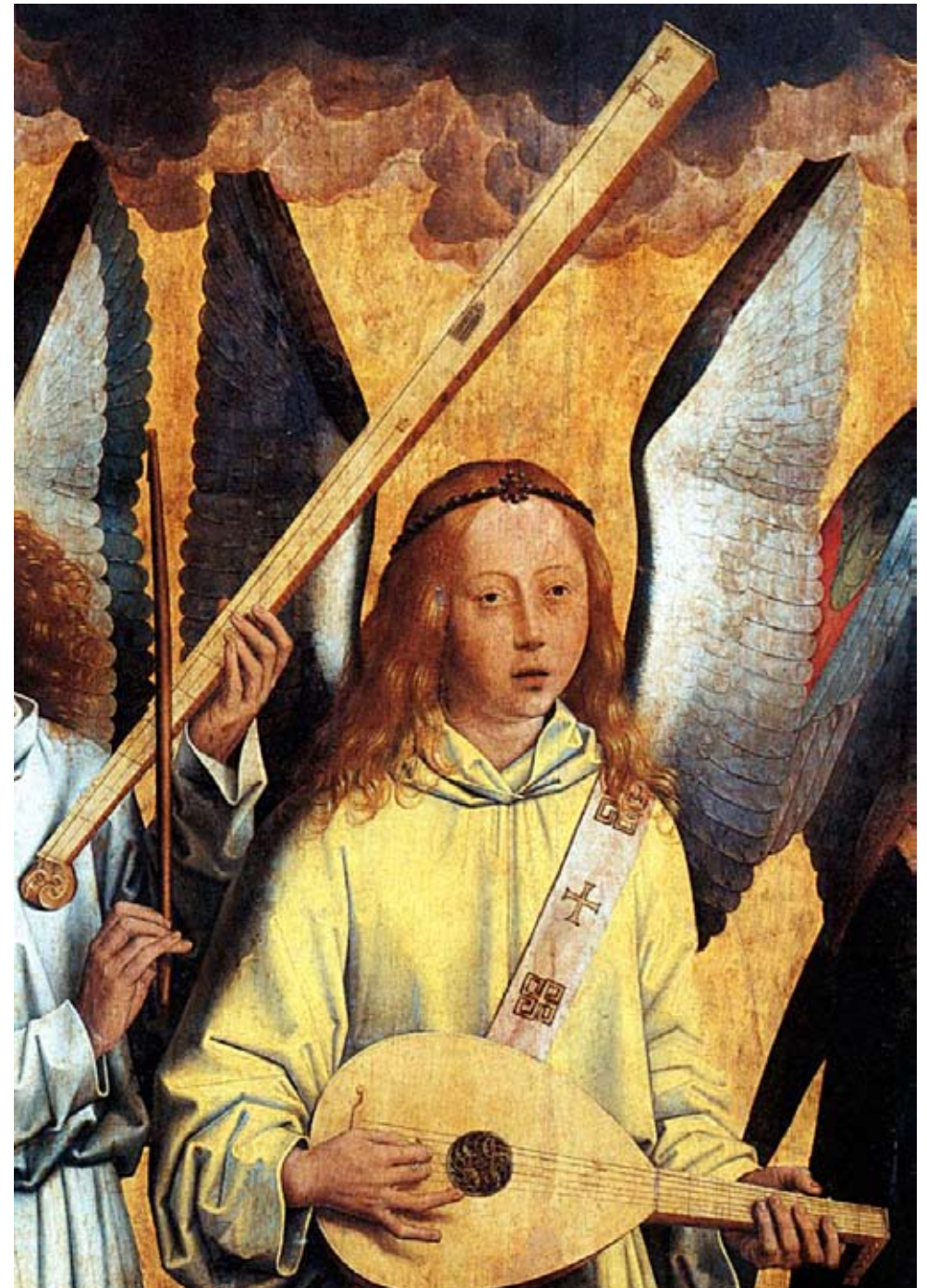
'Engelen'. Schilderij van Hans Memling ca. 1490