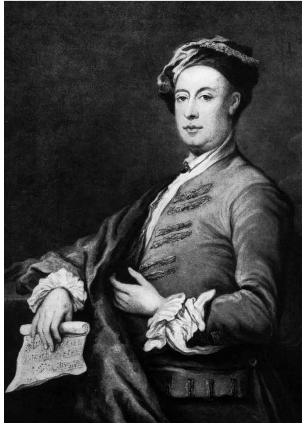
Georg Friedrich Händel © William Hogarth

open alle dagen 9 > 24 uur informatie en reserveren +32 (0)3 237 71 00 www.grandcafedesingel.be drankjes / hapjes / snacks / uitgebreid tafelen