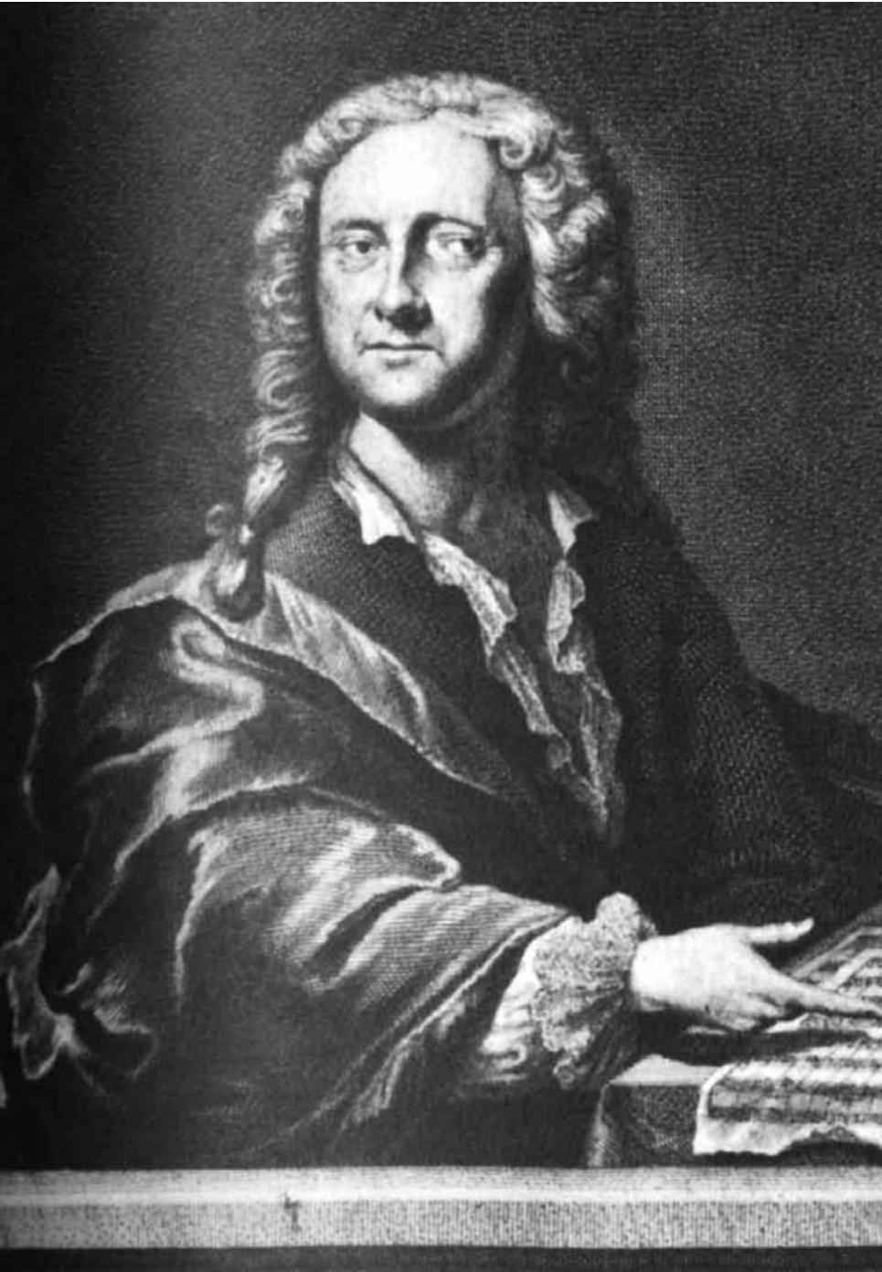
Georg Philipp Telemann