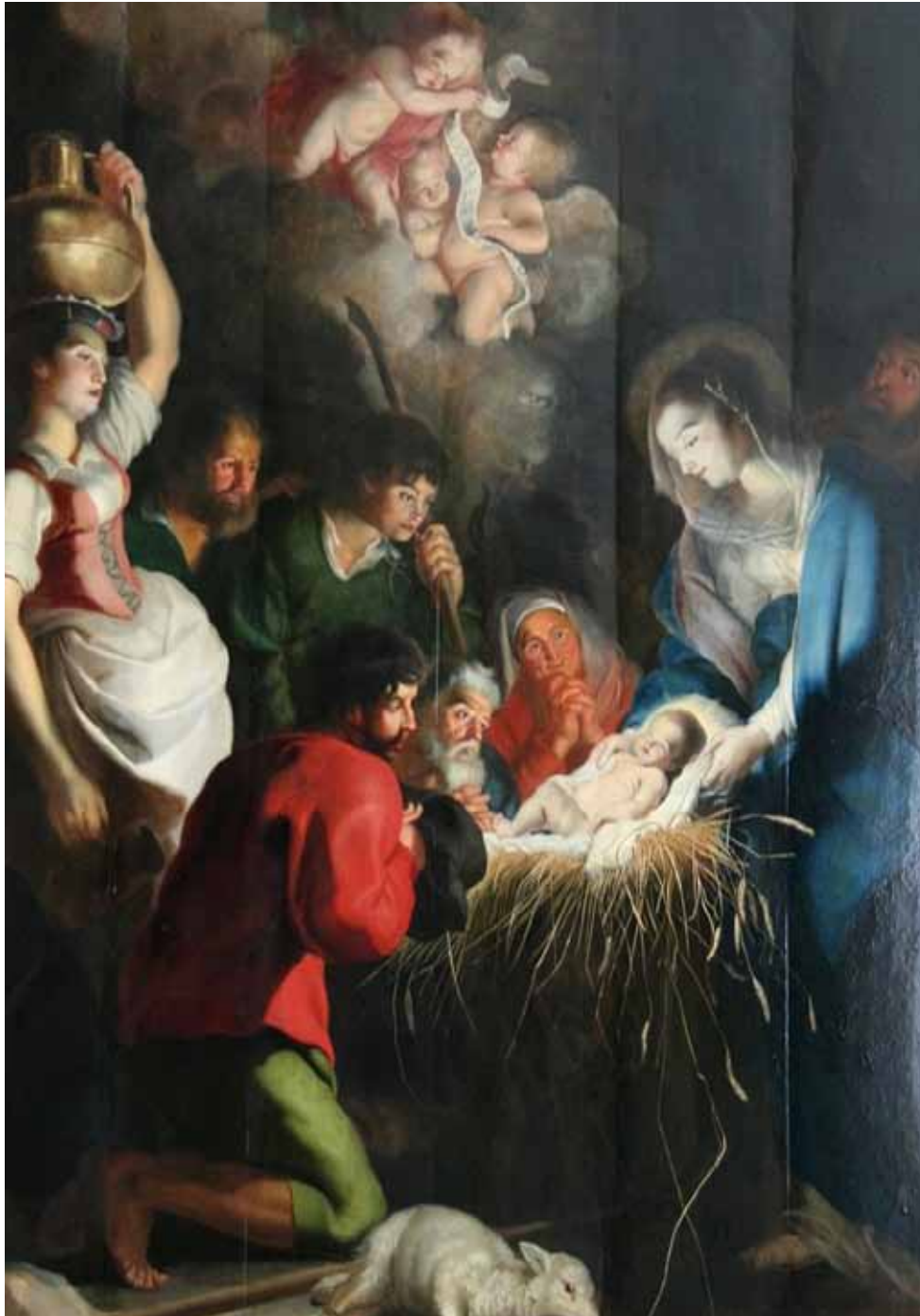
'De geboorte van Jezus'. Schilderij van Cornelius de Vos, 1618.