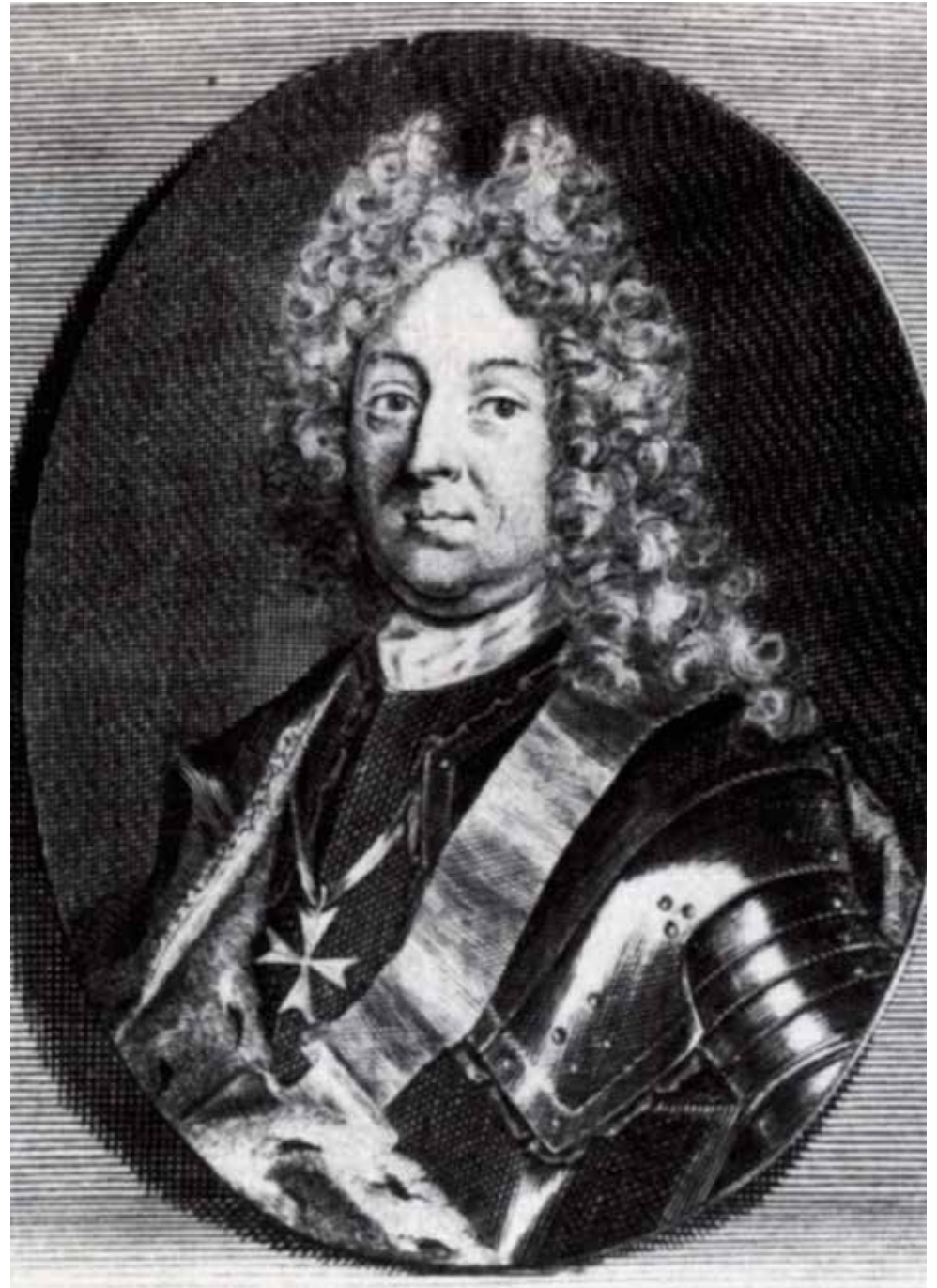
Christian Ludwig, Markgraaf van Brandenburg. Gravure van Martin Bernigeroth