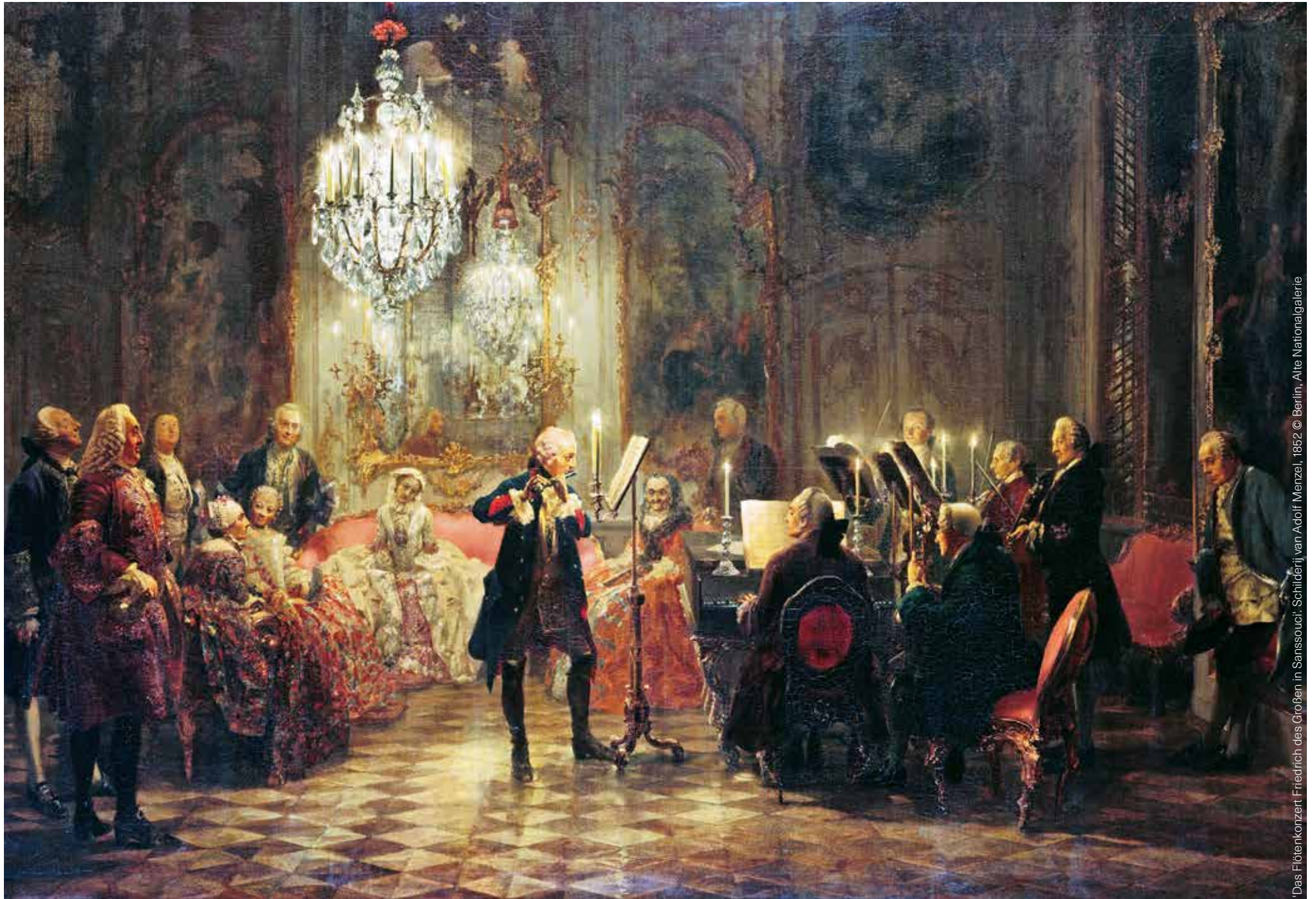
Das Flötenkonzert Friedrich des Großen in Sanssouci: Schilderij van Adolf Menzel, 1862 © Berlin, Alte Nationalgalerie