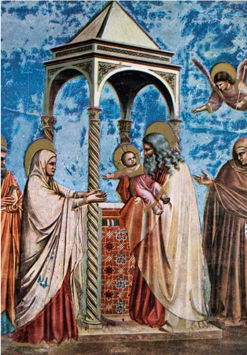
Giotto (± 1266-1337), 'Jezus' Opdracht in de Tempel', Padua, Scrovegni kapel.

De tekst van deze cantate (de tekstschrijver is anoniem) vertrekt vanuit Simeon. Dit bijbelse personage kan alleen in vrede afscheid nemen van het aardse leven en gelouterd worden wanneer hij de Gezalfde heeft aanschouwd. In het openingsdeel zet de traverso in met een klagende melodie ondersteund door een rustig kabbelende begeleiding van de strijkers. Na een dertigtal maten zet ook de zangstem in met dezelfde melodie op de woorden 'Ich habe genug'. Uiteraard doet de stijgende kleine sext van het openingsmotief denken aan 'Erbarme dich' uit de Mattheuspasie. Bach maakt in deze cantate veelvuldige transformaties van dit openingsmotief. Ook het tweede deel, een secco recitatief (declamerende zangstem met uitsluitend basso continuo als begeleiding), start met een dergelijke variant. In het middendeel van dit deel verschijnt een arioso (tus-