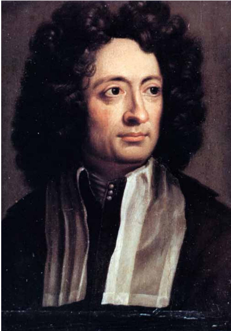
Arcangelo Corelli. Schilderij van Hugh Howard, ca. 1700