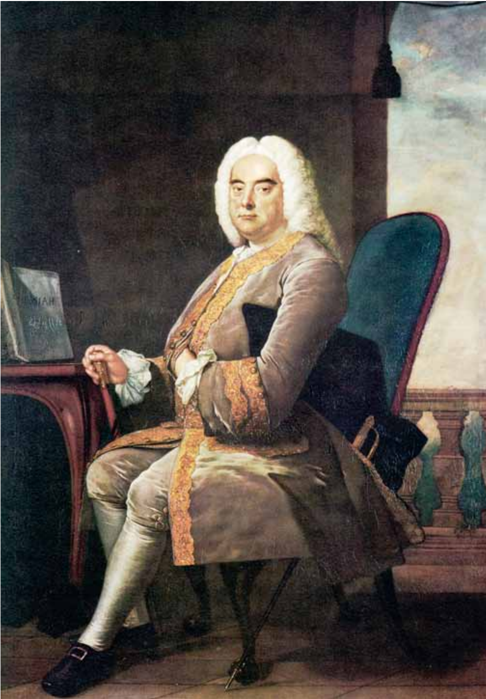
Georg Friedrich Händel. Schilderij van Thomas Hudson, 1756