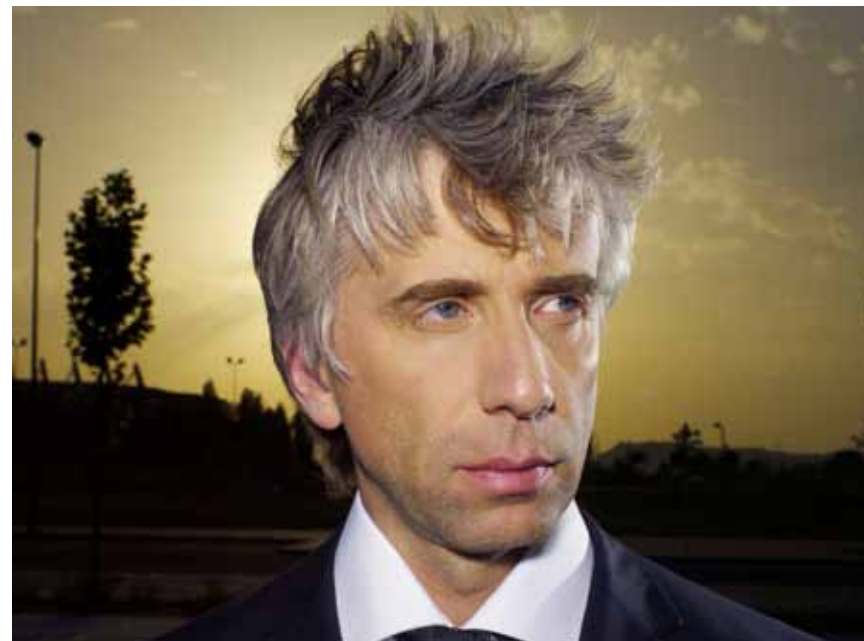
G. Antonini © David Ellis