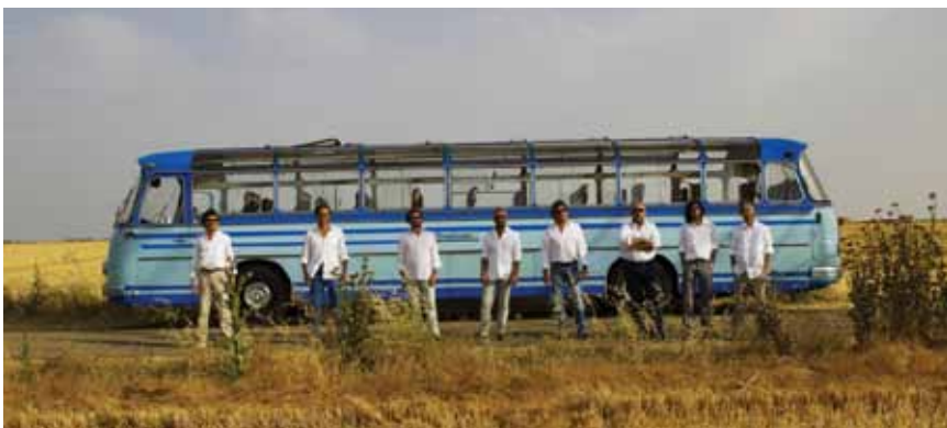
Il Giardino Armonico